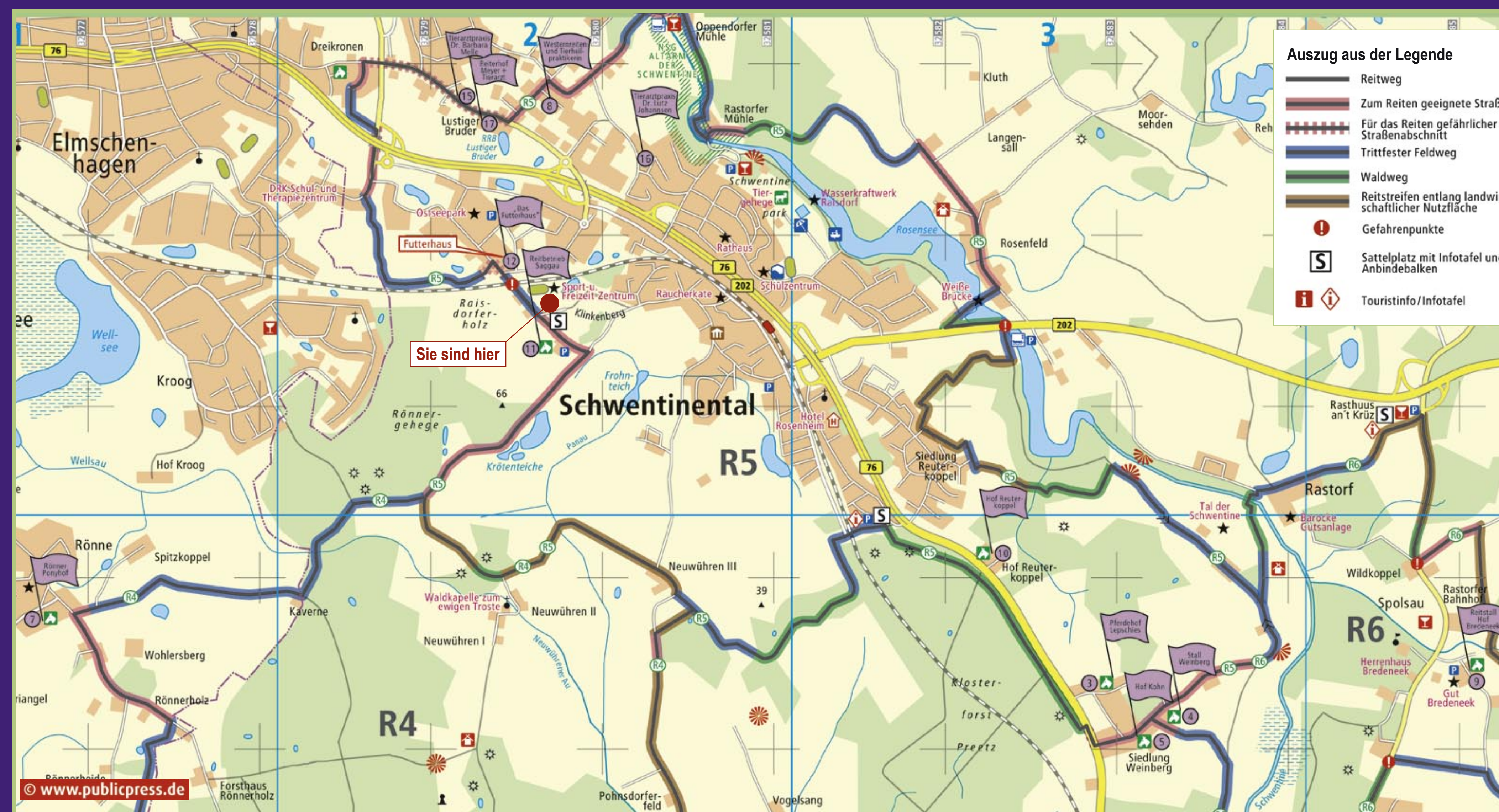
Der Rundreitweg R5 hat eine Länge von ca. 19 km. Sattelplätze befinden sich am Klinkenberg und an der B76.