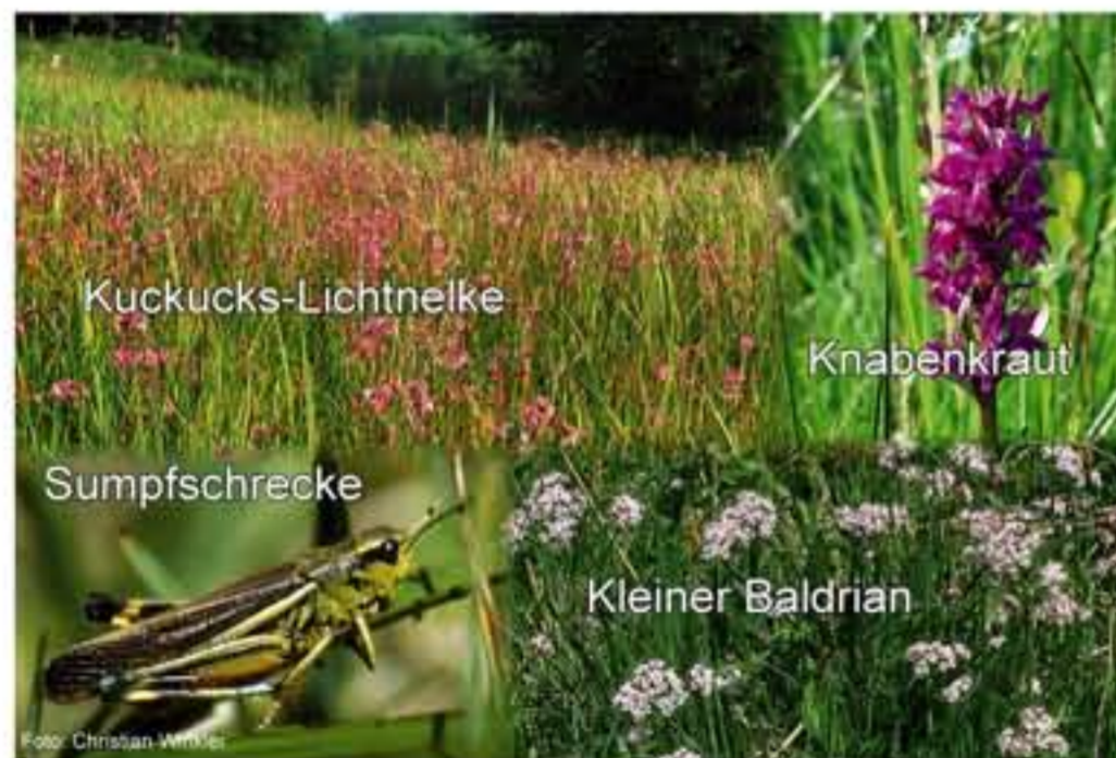
Die Moorwiesen als Lebensraum für eine bunte und seltene Tier- und Pflanzenwelt