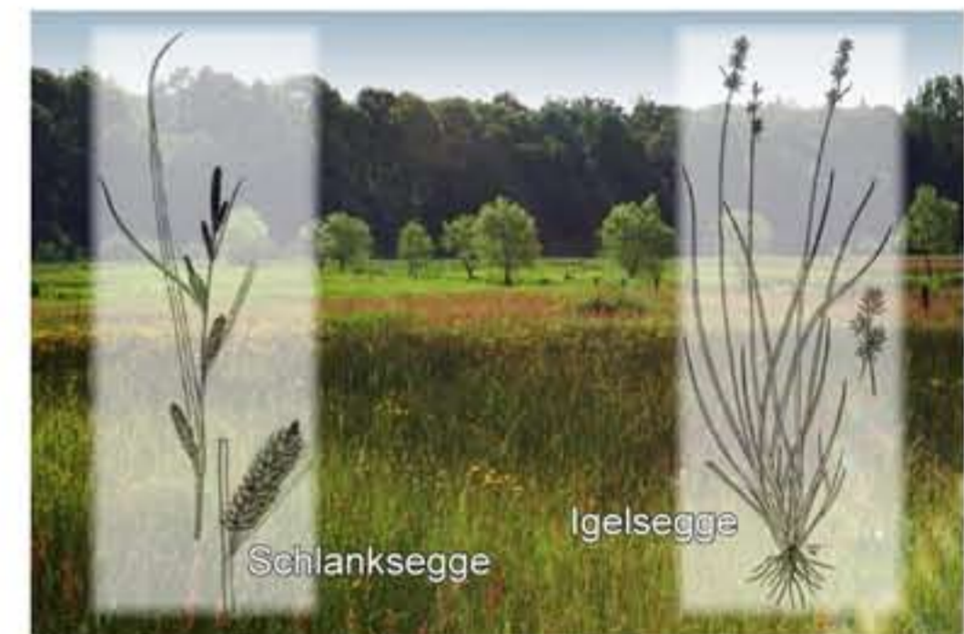
Sauergräser des Überflutungsmooeres (Schlanksegge) und des Durchströmungsmooeres (Igelsegge)

Unter den mächtigen Sandböden der Weinbergsiedlung liegt undurchlässiger Mergel (kalkhaltiger Lehm), der aus der letzten Eiszeit stammt. Über der Mergelschicht wird das Grundwasser zur Schwentine-Niederung abgeleitet und tritt am Rand der Niederung aus.