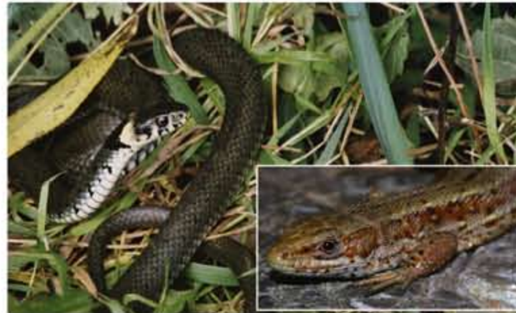
Ringelnatter (links) und Waldeidechse