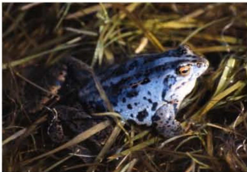
Das Moorfroschmännchen nimmt nur zur Paarungszeit im Frühjahr eine blaue Färbung an.

inzwischen rund 18 ha groß und beherbergt viele geschützte Tier- und Pflanzenarten. Zweimal im Jahr wird die Straße jeweils ca. 6 Wochen lang für den Autoverkehr gesperrt, um den Kröten und Fröschen ein gefahrloses Zu- und Abwandern zu ermöglichen.