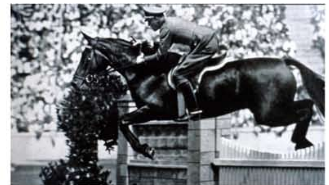
Olympiasieger Ludwig Stubbendorf auf „Nurmi“ aus der Zucht von Hans Paul

Da der Gutsherr selbst nicht hier wohnte, war der Gutsinspektor in dem Haus untergebracht. Dieses Inspektorhaus diente von 1952 bis 1970 als Schule. Gegenüber lagen die ehemalige Weizenscheune, die nach einem Brand 1968 nicht wieder aufgebaut wurde, und die Haferscheune.