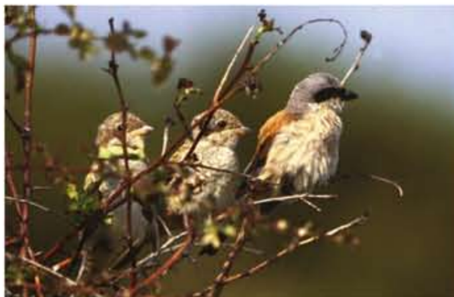
Neuntöter mit Nachwuchs

Das vom Naturschutzbund (NABU) betreute Schutzgebiet ist auch Heimat der gefährdeten Rotbauchunke, deren „uh-uh-uh-Rufe“ lauen Sommerabenden eine melancholische Note geben.