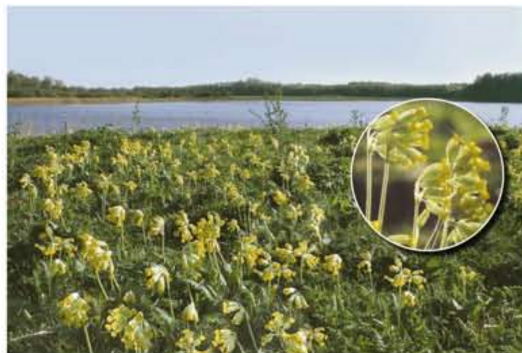
Echte Schlüsselblume ( Primula veris ) auf der Insel Appelwarder

Nur wenige Meter von diesem Standort am Freibad Lanker See zeigt ein kleine Ausstellung des NABU Preetz-Probstei die Vielfalt der Lebewesen und Lebensräume in unserem schützenswerten Naturerbe.